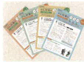
毎月最新の情報をNewsとしてお届け