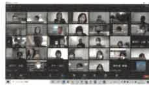
企業同士の情報交換オンライン会議の様子