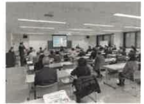
特別講師によるオンライン・オフライン/無料研修