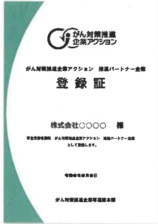
推進パートナー登録証をお送りします