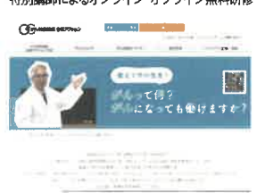
YouTubeでも議長の中川先生が講義